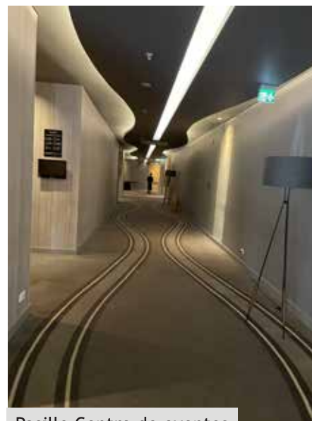
Pasillo Centro de eventos